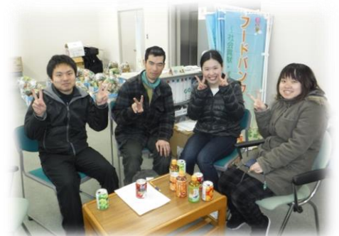
〈ボランティアの皆さん〉