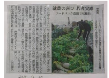
2015. 12. 20 徳島新聞掲載