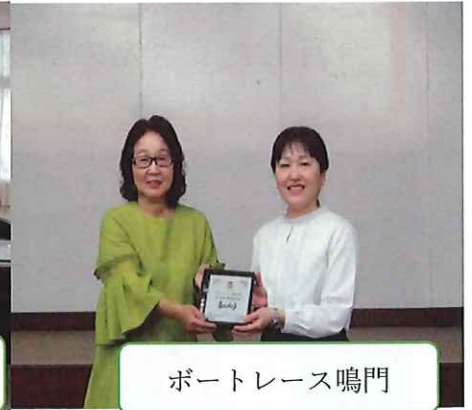
ボートレース鳴門

第9回総会より、一年間を通して活動にとりわけご協力頂いた団体3団体に感謝状をお渡ししています。今年度は「徳島プリンスロータリークラブ」「徳島県立城西高等学校生徒会」「ボートレース鳴門」の3団体とさせて頂きました。