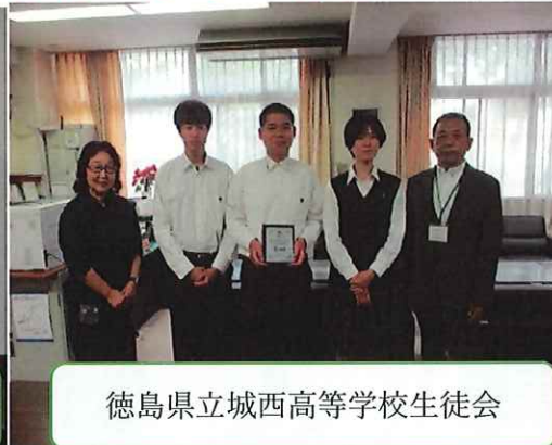
徳島県立城西高等学校生徒会