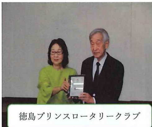
徳島プリンスロータリークラブ