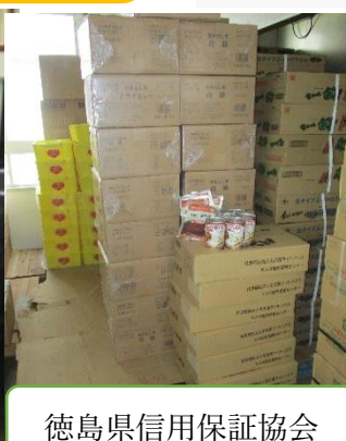
徳島県信用保証協会