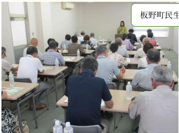
板野町民生・児童委員協議会研修