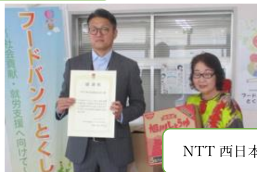
NTT 西日本徳島支店 様