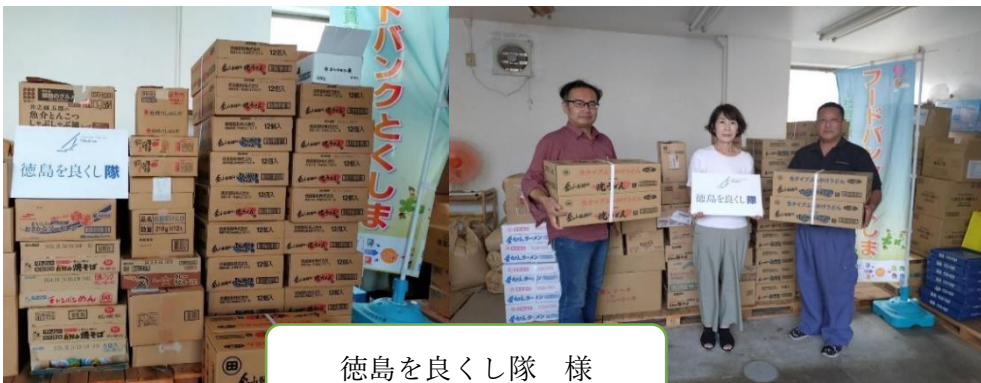
徳島を良くし隊 様