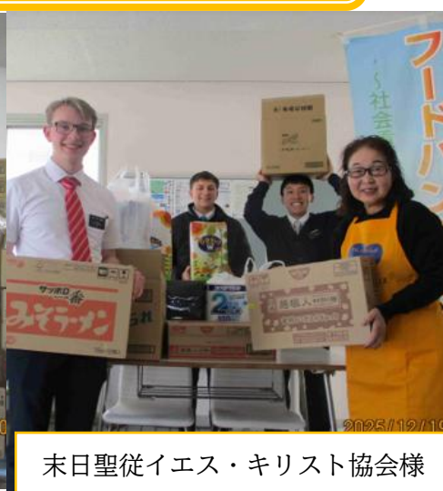
末日聖徒イエス・キリスト協会様

キョーエイすきとく市、コープ自然派しこく、とくしま生協(本部・住吉店・北島店)、徳島青果(株)、JA 徳島県、JA 徳島市、JA 東とくしま、解脱会、ゆめタウン徳島、イオンスタイル徳島、(株)フジ・マルナカ、ワコー、大東建託パートナーズ(株)、(株)姫野組、徳島市役所、上板町産業課、日本生命徳島支社、徳島人生たすけあい家、ワコー、わかや食農デリ合同会社、阿波市ファミリーサポートセンター、鳴門市「よりそい」、エコみらいとくしま、(一社)愛媛県晴活、その他個人の方々16 名